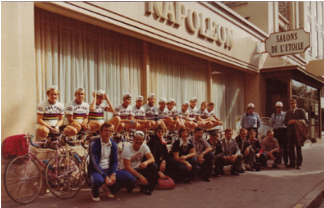
De nog frisse renners en begeleiders voor hotel Napoleon.