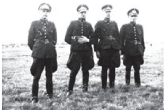
Het openluchtspel de Geheimen van de Heilige Mis niet zonder Duits toezicht.