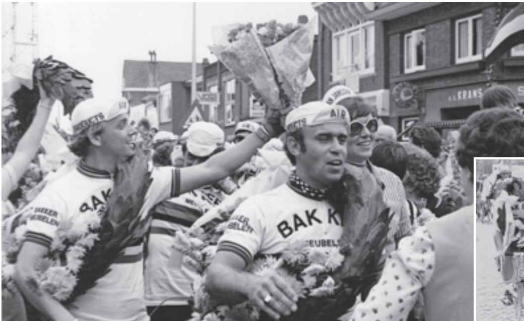
Renners worden gehuldigd.