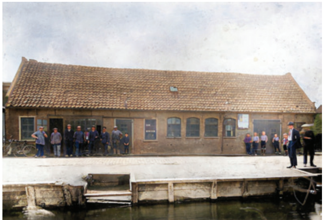
De loodgieterswerkplaats, smederij en rijwielhandel aan de Kerkweg vlak bij de Dorpstraat. Ingekleurd door Dick-Jan Thuis.

Een familie van Waddinxveense ondernemers