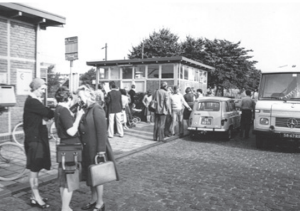
Vertrek station Waddinxveen.