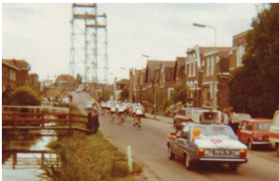
Renners op de Brugweg.