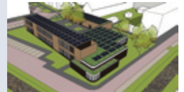
Impressie van Wereldwijd na de verbouwing. Vooraan, in het lage deel komt de ruimte voor ons Genootschap. In het rechthoekige gebouw achter het hoofdgebouw komt ons depot.