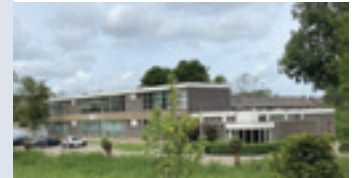
Wereldwijd 21 mei 2022.

Vier cd's en twee video's van (oud)-Waddinxveen.