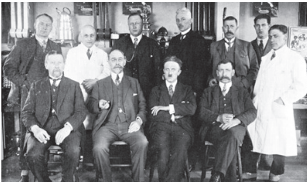
De werkplaats aan de Kromme Nesse. Bron: familiearchief. Ingekleurd door Dick-Jan Thuis

In 1953 werd het pand aan de Zuidkade 16 verkocht aan dameskapper Van Es. In het er achterliggend gebouw had kapper Krijn Bijl zijn kapperswinkel. <